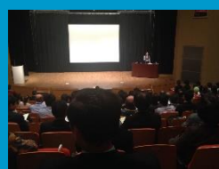
農村活性化フォーラム