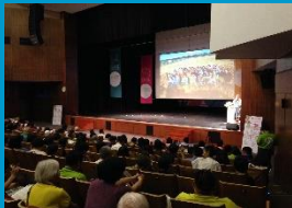
台湾 南方農業論壇