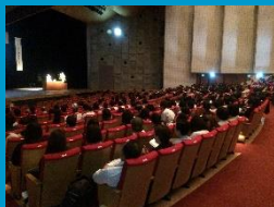
いばらき看護の祭典