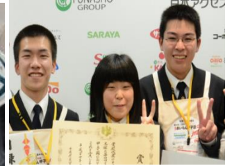
『海洋高校 宮津ブイベースラーメン』