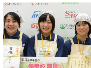
『れんコーン！洋風春巻き』