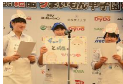
メニュー名：ぎゅっとsaitoma!!プレミアムパスタ 諸味ソースかけ 受賞：生産局長賞