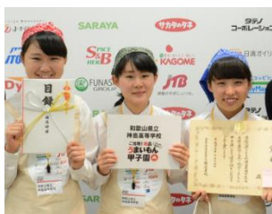
『めはりんと、おにぎらずんの出会い』