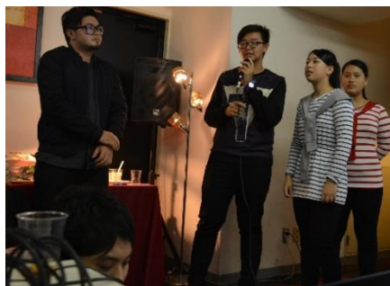
「JTBうまいもんサミット」では、通訳を介してメニューを紹介したり、日本の高校生のプレゼンを真剣に聞いていました。