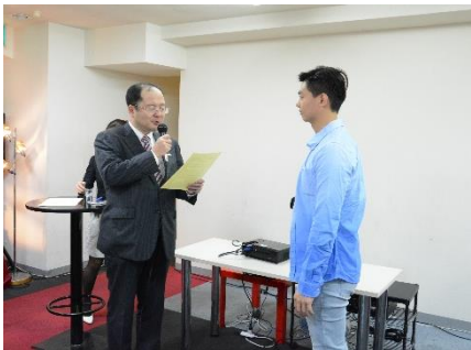
「JTBワールドうまいもん賞」として、招待校を表彰