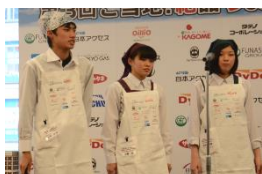
メニュー名：とって隠岐の島(ピザ) 受賞：水産庁長官賞

【参加】 1. 島根県立隠岐水産高等学校…3名 2. 埼玉県立杉戸農業高等学校…3名